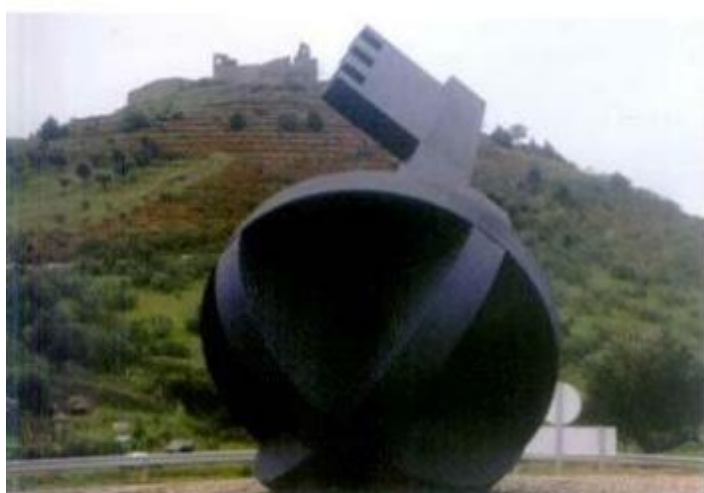
Rotunda da Ponte de Alcácer

Chave de Honra embeleza rotundas Cidade Aberta ao Futuro