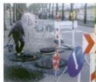
Reparação das torções de esgotos, na Avenida Gago Coutinho