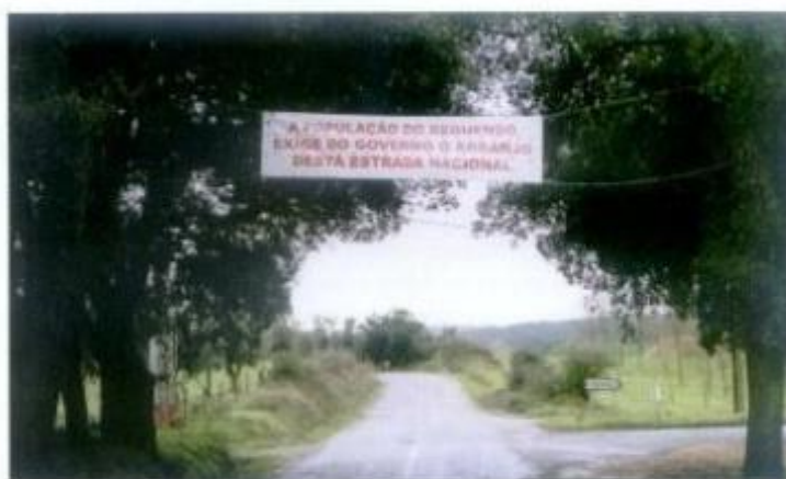
O Reguengo é uma das muitas localidades afectadas pelo estado caótico da E.N. 2

Criança a moldar o barro na Oficina da Criança