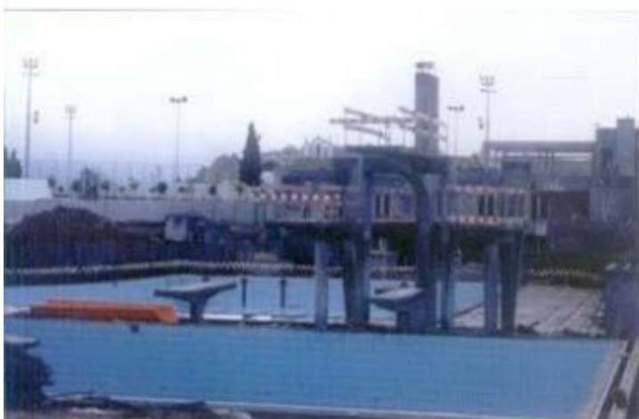
Construção das piscinas municipais recreativas