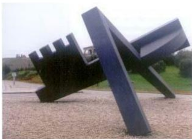
Rotunda da Maia

O ano de 2000 terminou, em Montemor-o-Novo, com um simbolismo muito especial. Efectivamente, o dia 31 de Dezembro foi a data escolhida para a inauguração das três rotundas exteriores da cidade (Maia, Lanita e Ponte de Alcácer, na Estrada Nacional 253 - Montemor-o-Novo/ São Cristóvão).