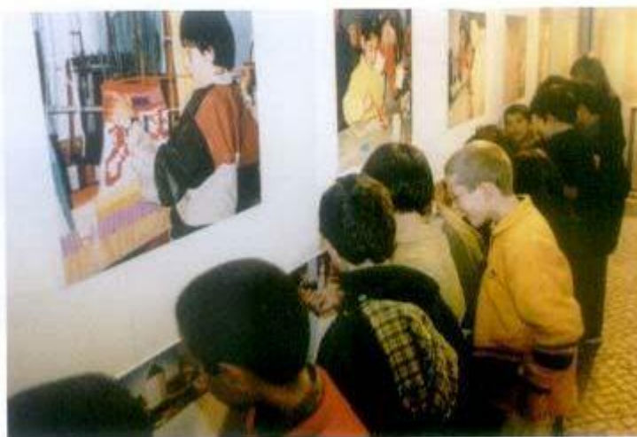
Crianças: passado, presente e futuro da Oficina da Criança

Para assinalar, da melhor forma, este aniversário, a Oficina da Criança organizou uma exposição intitulada " Olhar um Percurso ", que esteve patente na Galeria Municipal até ao fim de Janeiro,