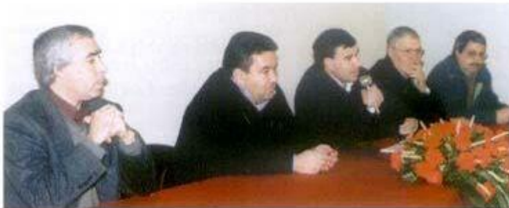
Lerménia da tomada de Posse dos Órgãos Regionais da STAL

Os Órgãos Regionais do distrito de Évora do STAL (Sindicato dos Trabalhadores da Administração Local) , recém eleitos para o triénio 2001/2003, tomaram posse no passado dia 10 de Janeiro.