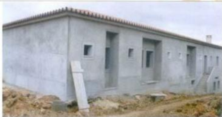
Construção da Lar e Centro de Dia de Cabrela

desenvolvimento económico, uma solidária acção social e a melhoria da qualidade de vida.