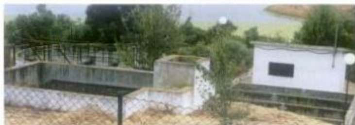
ETAR de Cabrela

Quanto a investimentos, os mais vultuosos prendem-se com as Piscinas Recreativas (600 mil contos), o Pavilhão Gimnodesportivo (140 mil contos), a Reabilitação urbana no concelho (131 mil contos), o Parque de Exposições (30 mil contos), o apoio à conclusão da construção das bancadas do GUS (10 mil contos), o campo desportivo do Grupo Estrela Escouralense (12 mil contos) e o apoio a lares (10 mil contos).