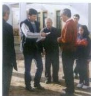
Encontro com a população de Faria de Vale de Figueira

Todas estas reuniões serão públicas e terão o seu início pelas 15 horas, no Salão Nobre da Câmara Municipal. Quanto ao período de atendimento ao público, terá o seu início pelas 20,30 horas.