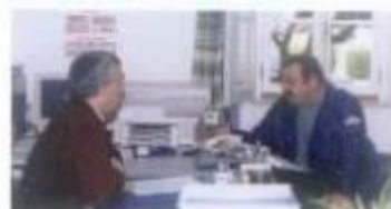
Atendimento à população em Santiago da Escoural

18 de Janeiro - Casa Branca; 8 de Fevereiro - Cortiçadas de Lavre; 1 de Março - Fazendas do Cortiço; 22 de Março - Ferro da Agulha; 19 de Abril - Escoural; 10 de Maio - Reguengo; 31 de Maio - São Geraldo; 28 de Junho - Ciborro; 12 de Julho - Foros de Vale de Figueira; 6 de Setembro - São Cristóvão e Baldios; 11 de Outubro - Santa Sofia.