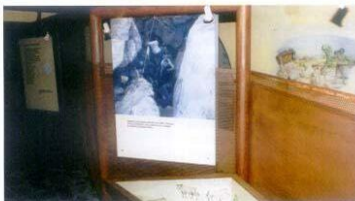
Aspecto do Centro Interpretativo da Gruta do Escoural