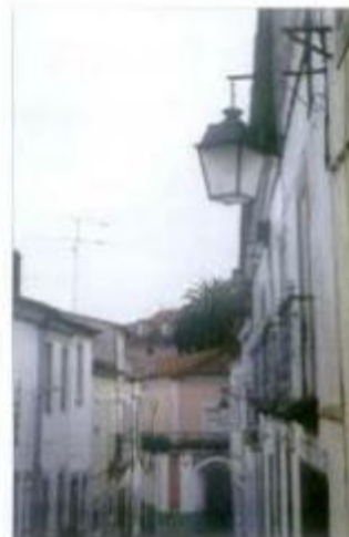
No Centro Histórico da cidade foi reforçada a iluminação pública