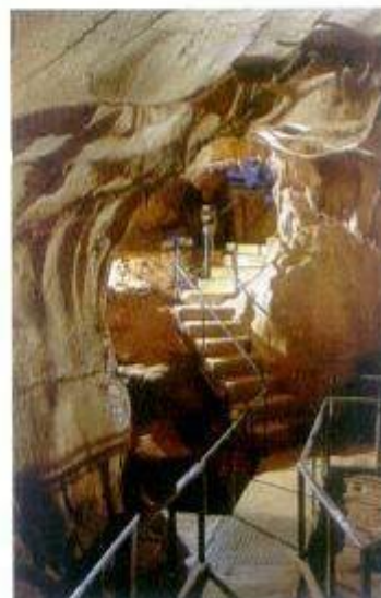
A Gruta do Escoural

Este Centro, uma forte reivindicação da população e das autarquias ao longo dos tempos, inclui uma exposição de carácter permanente e visa dar informações sobre a Gruta (fica a 4 Km da localidade). Serve, ao mesmo tempo, para cativar os visitantes e ajudá-los a conhecer melhor a Gruta e a vila de Santiago do Escoural.