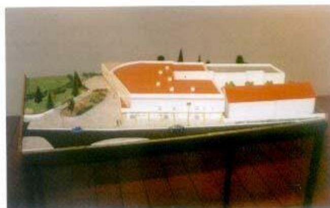
Maquete das futuras instalações do Centro de Animação Sócio-Educativo