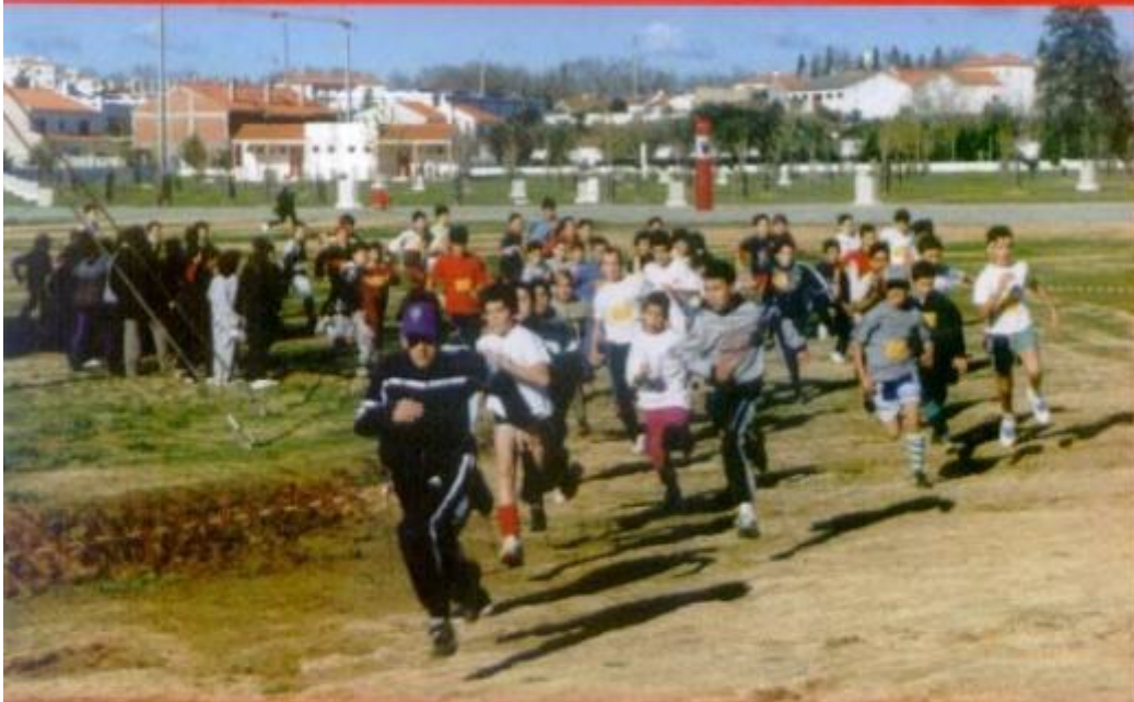
Centenas de atletas do concelho participaram no Corta-Mato Escolar em Dezembro último