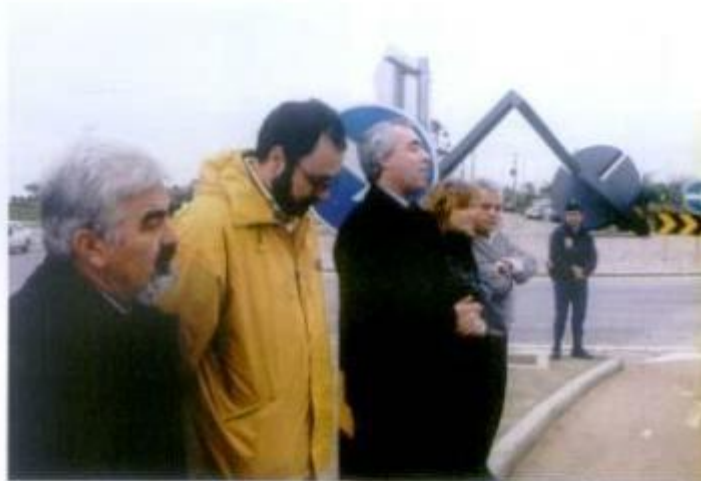
Cerimónia de inauguração (Rotunda da Maia)

Futuramente, estas três rotundas serão alvo de iluminação, permitindo a quem entra ou sai de Montemor no período nocturno, usufruir da sua beleza.