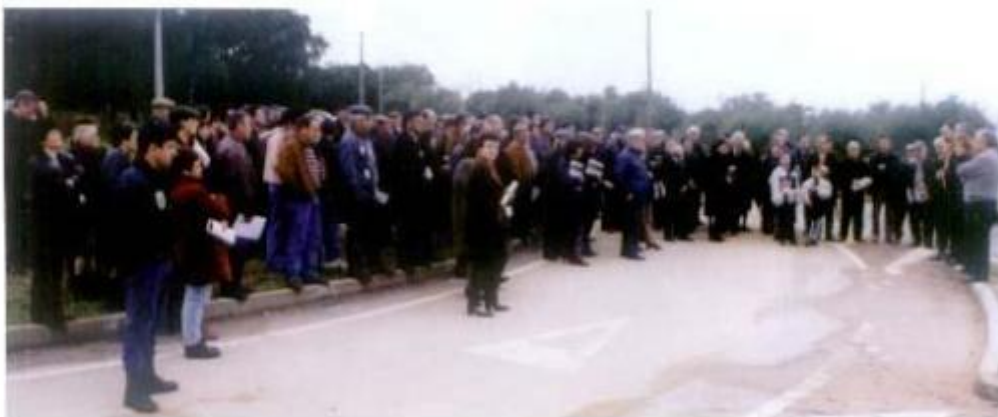
A população não deixou de comparecer na inauguração das rotundas