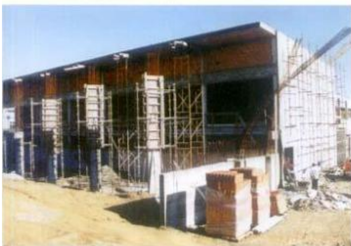
Construção do Pavilhão Gimnodesportivo

As Opções do Plano e o Orçamento para o ano de 2001, da Câmara Municipal, foram aprovadas na sessão de fim de ano da Assembleia Municipal, que teve lugar no dia 22 de Dezembro.