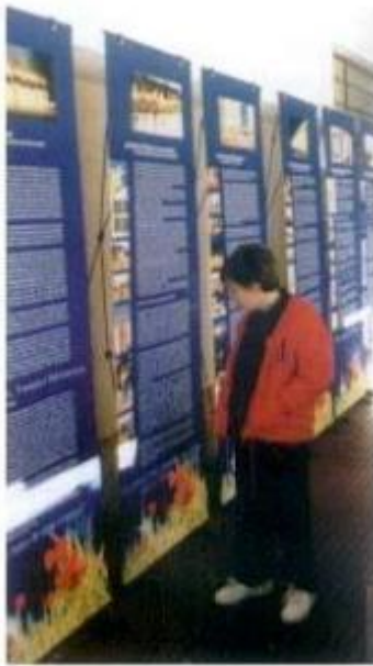
Inauguração da exposição "Montemor: Passado, Presente, Futuro"

A chegada do 3.º milénio e consequentemente, do século XX., trouxe para o concelho de Montemor, uma nova imagem, como marca da cidade, do concelho e do município.