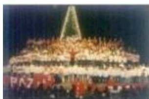
O Curvo-Semedo encheu para receber “A Mensagem”