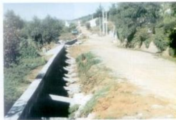
Na Pinçada está a ser construído um muro de suporte à estrada.