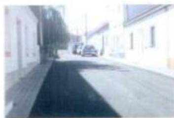
Na Ciboma foi efectuada a pavimentação da Rua 14 de Agosto.