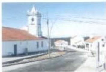
Está em fase de conclusão a pavimentação da Rua de S. Sebastião em S. Geraldo.