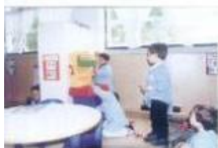
Crianças do Jardim de Infância de Fozes de Vole de Figueira

Como em anos anteriores, a autarquia, em estreita colaboração com as diferentes Juntas de Freguesia, volta a