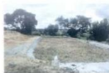
Na Ferra da Agulha está a proceder-se à construção de uma ETAR.