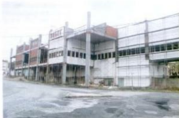
Por acordo entre o CUS e a Câmara Municipal reconeçeram a os obras de construção dos bancos da Estádio 1º de Maio.