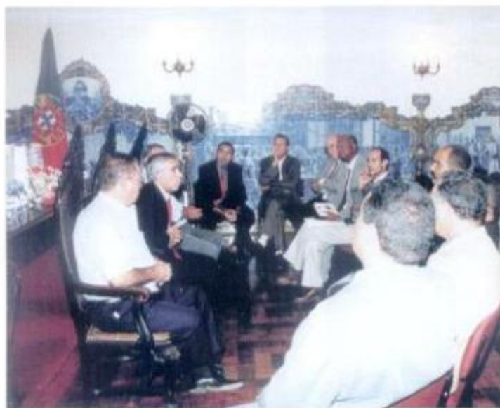
O Presidente da Câmara Municipal de Montemor-o-Novo durante a recepção de boas vindas à delegação marroquina

Dando continuidade a este acordo, uma comitiva de representantes da Comunidade Urbana de Safi visitou, nos dias 17 e 18 de Setembro, o concelho de Montemor-o-Novo, estreitando e dinamizando esta cooperação.