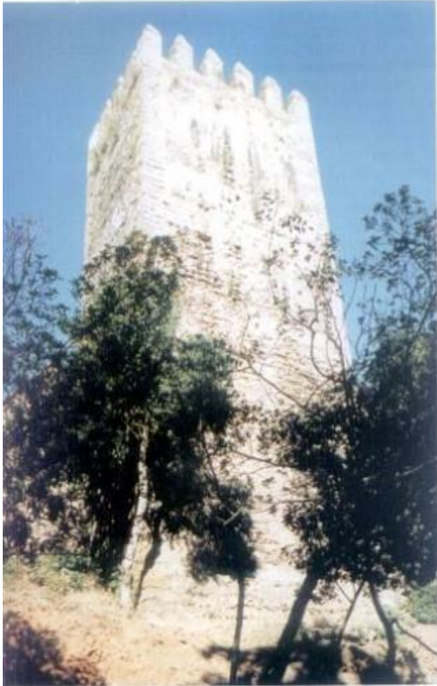
Tiveram início os trabalhos de consolidação da muralha, junto à Torre da Mãe-Hora. Esta intervenção é da responsabilidade do IPPAR.

Investimento em Montemor cria investimento