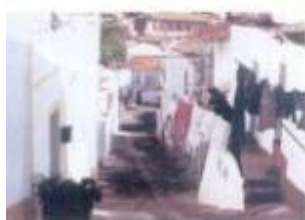
1ª Prémia - António Nascimento

Pelo quarto ano consecutivo a Câmara Municipal através do seu Posto de Turismo, organizou mais uma edição da Maratona Fotográfica, iniciativa integrada nas comemorações do Dia Mundial do Turismo.