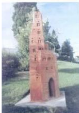
Escultura de Arthur Meyer

Disseminou, recentemente, o III Simpósio de Escultura em Terra (Cota), Habitar 2001, que incluiu a colocação de seis esculturas em diversos locais da cidade. Este simpósio, uma organização da Associação Cultural de Arte e Comunicação "Oficinas do Convento", contou com o apoio da Câmara Municipal e do Programa Operacional da Cultura.