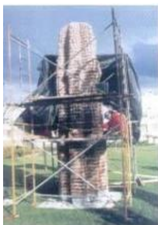
Escultura de César Correjo