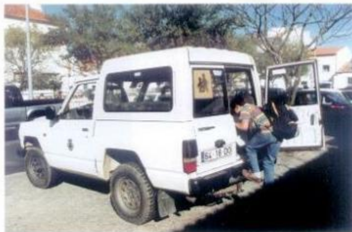
Os transportes escolares são um dos apoios mais importantes que a autarquia presta às crianças do concelho