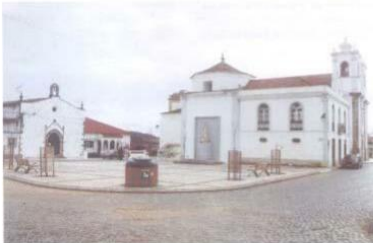
A outaruga procedeu ao arranjo exterior do Largo de S. Sebastião