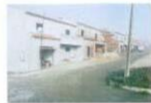
Construção de loteamento em Silveiras