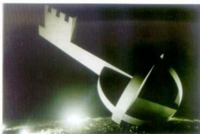
A Câmara Municipal procedeu à iluminação das rotundas situadas na EM 253.