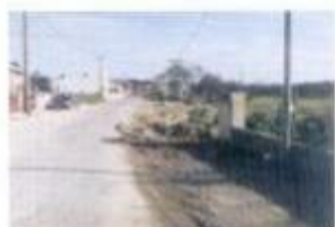
Construção do colectar pluvial na Courela da Moura de Vento em Corçoadas de Lavre