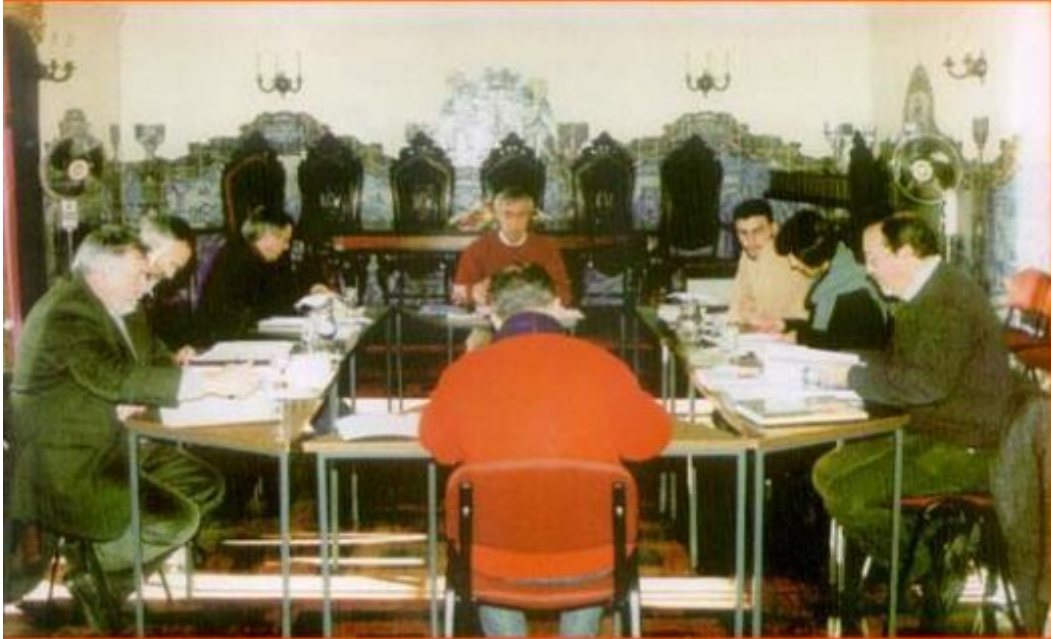
Reunido de Câmara do novo Executivo Municipal