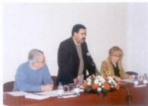
O anterior Presidente da Assembleia Municipal deu posse aos novos eleitos.