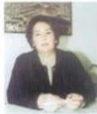
J.Freguesia de N.ª Sr.ª do Bispo Vitalina Roque Safo (CDU)