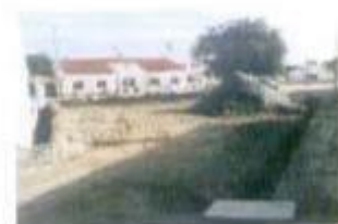
Arranjos exteriores no Bº da Ajuda em Cursejães de Lave