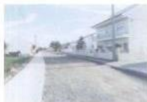
Arranjo das ruas 1.ª de Maio e Genito Caravala em Faras de Vale de Figueira