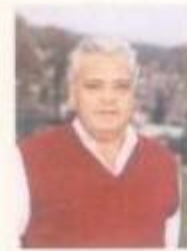
Presidente da Assembleia Municipal José Y. Grulha (CDU)