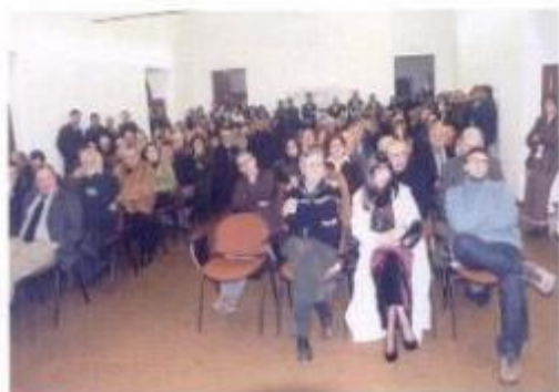
O muita público encheu por completo o salão da Auditoria da Biblioteca Almeida Faria