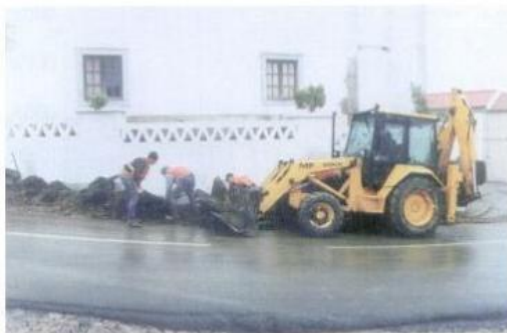
No Lousoural estão a proceder a construção de infraestruturas e a pavimentação de diversas ruas