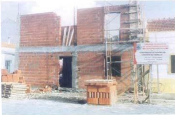
Obras de construção do Centro Comunitário de Cabreia