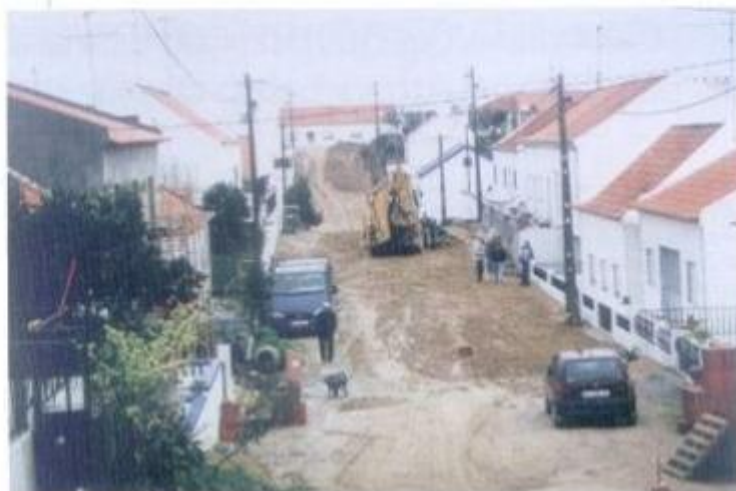
No freguesia de Cihorra estão a decorrer obras de construção de infraestruturas e pavimentação em várias ruas daquela localidade.