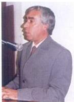
O Presidente da Câmara durante a sua intervenção