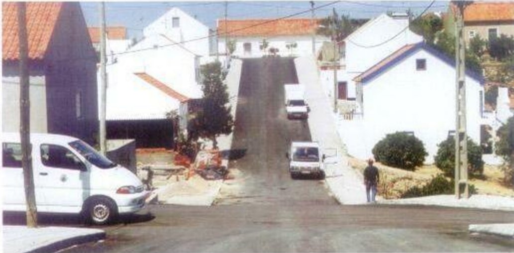
A Avenida de Valenças é uma das ruas do Cíborro que foi pavimentada