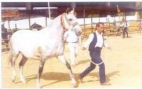
Concurso Nacional de Fêmeas Jovens de Puro Sangue Lusitano