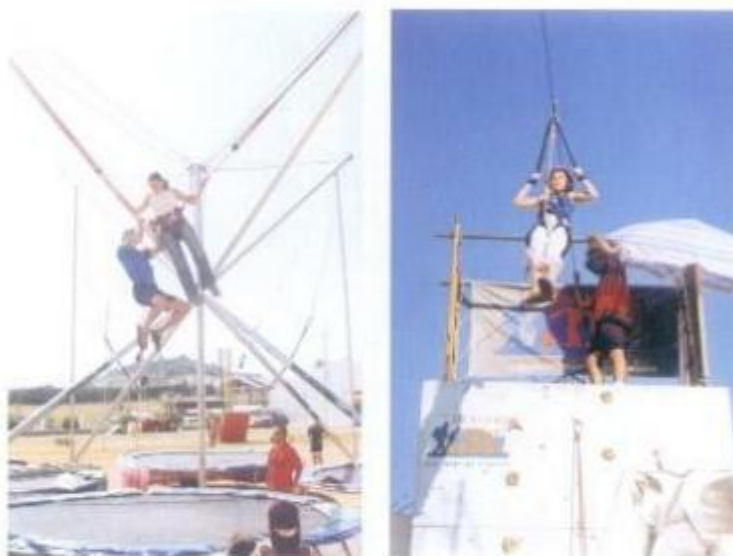
Os Desportos Aventura tiveram grande adesão, sobretudo pelos camadas mais jovens.

1.º CN Beja; 2.º CM Fundão; 3.º CM Montemor A; 4.º Alcácer do Sal; 5.º Montemor B; 6.º CN Beja (extra concurso).