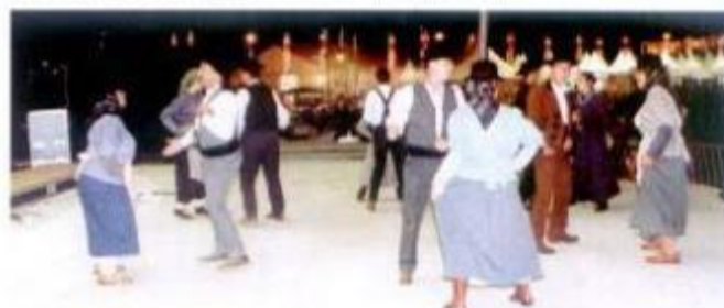
Uma das noites mais animadas foi a do Festival de Folclore