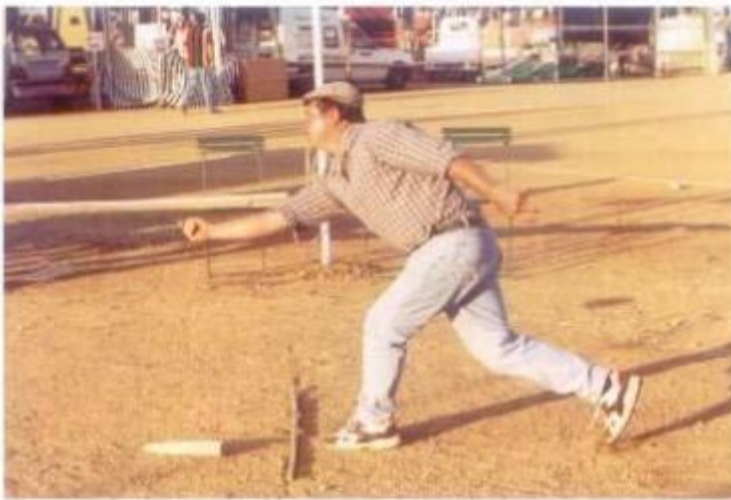
O Torneio de Malha, como sempre, marcou presença no recinto da Feira da Luz.