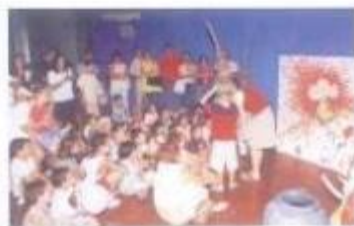
Animação de leitura para os mais pequenos

No último dia da Feira teve lugar a Animação de Rua "ZAS TRÁS PAS", pelo grupo Vicenteatro.