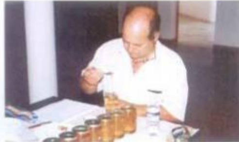
O melhor mel do concelho a concurso durante o Feiro da Luz