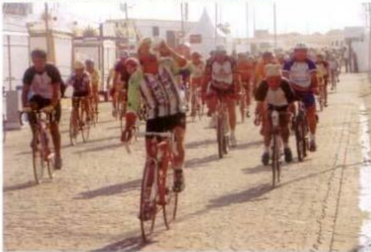
A Prova de Ciclismo avistou diversas ruas da nossa cidade antes de parar para Lousa.