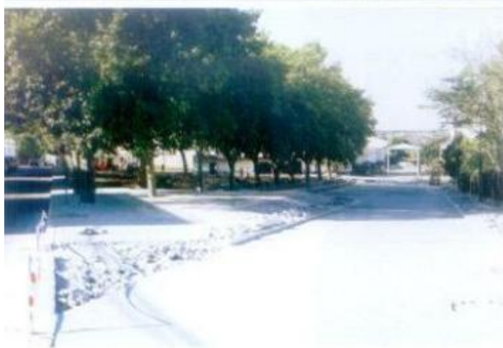
Arroyos exteriores do Largo Machado dos Santos e Home de Gava.