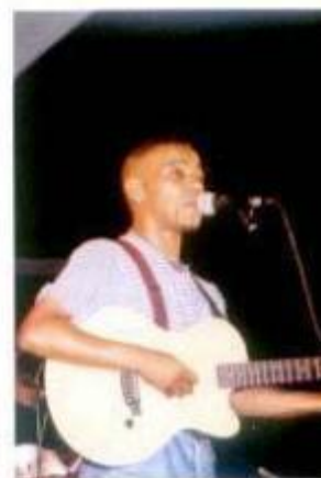
Os ritmos de Cabo Verde estiveram presentes com Tito Paris.