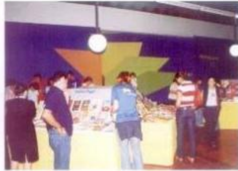
A Feira do Urro continua a ser um sucesso na Feira da Luz