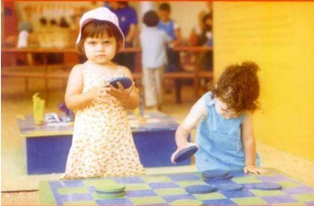
Os mais pequenos adoraram o Pavilhão da Oficina do Criança/Festa da Luz 2002