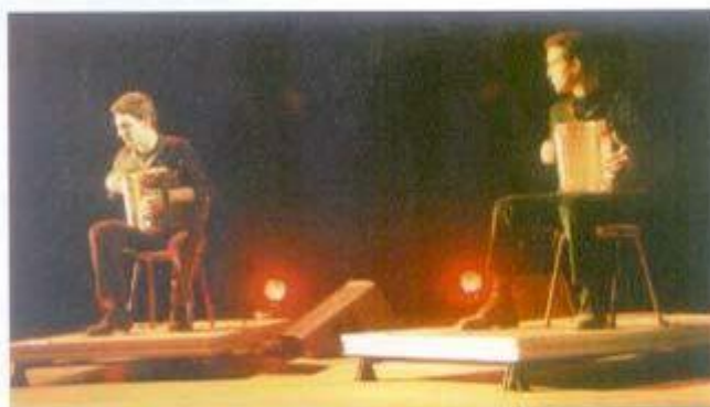
Negros de Luz foi um dos espectáculos aplaudidos durante a edição do ano passado das "Musicalidades".

As Musicalidades encerram dia 26, com os Tetvocal, num espectáculo que terá lugar no Cine-Teatro Curvo Semedo.