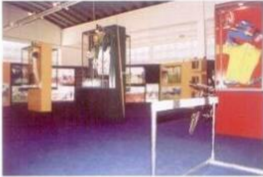
O Desporto foi o grande tema da exposição do Câmara Municipal