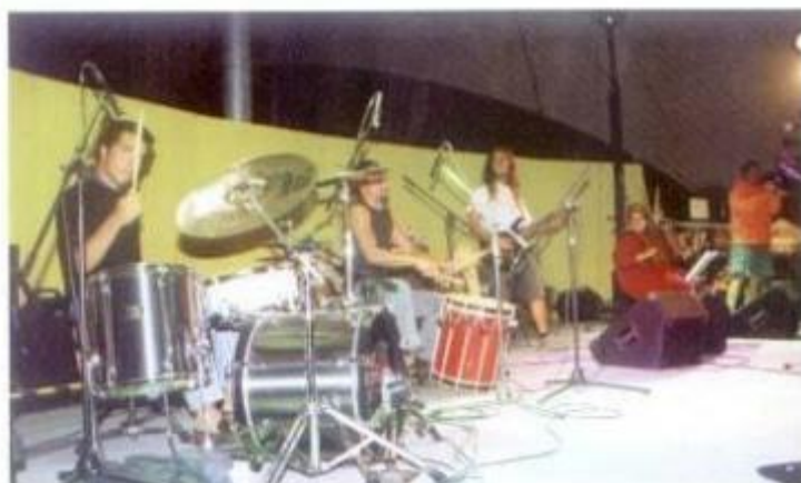
Os Xukaluz deram um dos mais animados concertos no novo palco pequeno.