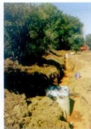
Emissário de saneamento básico nas Siveiras.