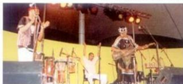
Os "Noss Maraquech" animaram o palco pequeno na 1ª noite da Feira da Luz