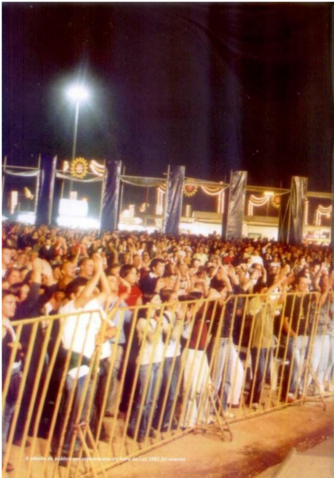
A adesão do público aos espetáculos da Feira da Luz 2002 foi enorme.