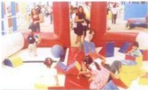
Espaço de brincadeira para as mais novas...