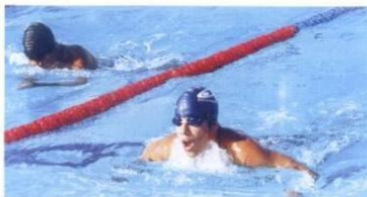
No Festival de Natação, que decorreu nas Piscinas Municipais, participaram cerca de 140 atletas.