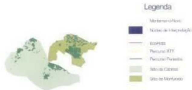
Áreas de interpretação do 1.º e 2.º Fases do Projecto "Conhecer e Preservar a Rede Natura 2000 em Montemor-o-Novo"

Na mesma ocasião foi apresentada a 2ª Fase do Projecto, em fase de candidatura, que inclui a adaptação da antiga linha de comboio Montemor-Ferre da Gadanha para fins de EcoPista , e a edição de um CD sobre os valores naturais e patrimoniais dos Sítios de Cabrela e Monfurado.