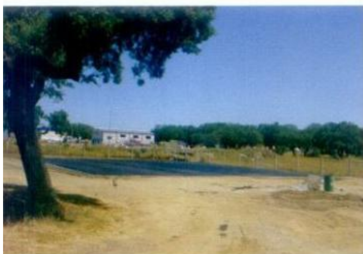
Unidade Piloto de Co-Compostagem instalada na Zona Industrial da Adufeia.