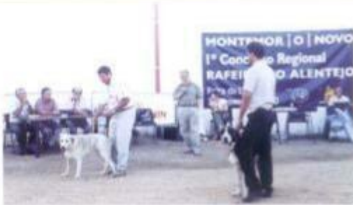
O 1º Concurso Regional do Rafeiro do Alentejo superou as expectativas