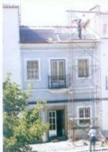
Recuperação de habitação no Largo dos Paços do Concelho.