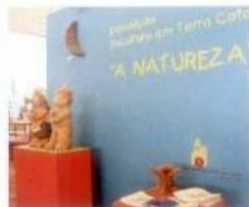
Espaço da Oficina da Criança onde a Natureza esteve em destaque