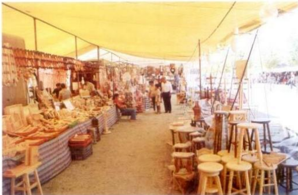
A zona tradicional da Feira da Luz continua a ser um atractivo para muitos visitantes