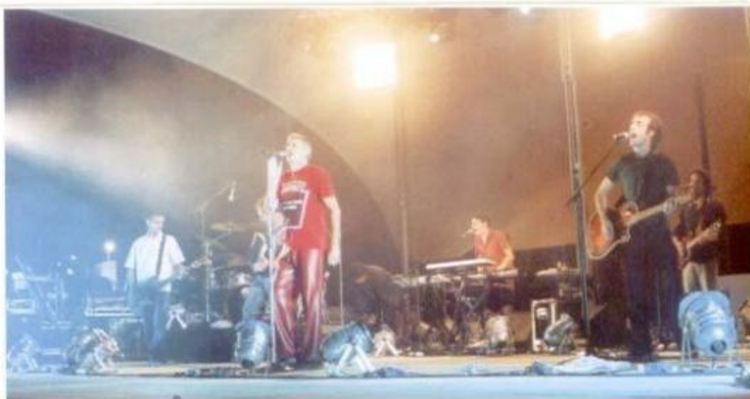
Os GNR fecharam com "chave de ouro" a edição deste ano da Feira da Luz.