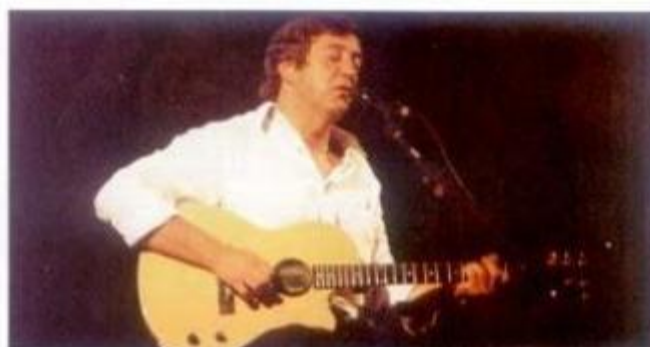
Rui Veloso reviviu os 20 anos da sua carreira no palco da Feira da Luz

Novidade desta edição foi a existência de um palco pequeno que acolheu os "Noss Maraquech", com música tradicional mamquina e de outros países, e o grupo "Uku Kithus", com animação de danças tradicionais europeias.