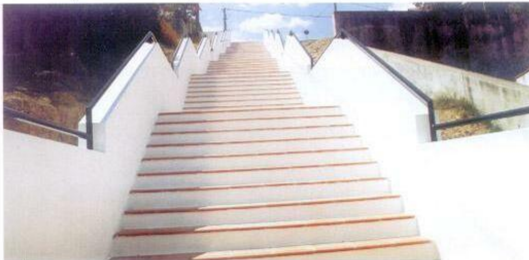
Escada de acesso à Rua da Igreja no Cíborro

Correcção de Informação - Na página n.º 13 do Boletim Municipal n.º 173, na rubrica "Construir para Desenvolver", a fotografia da legenda "Construção da Estação de Compostagem na Zona Industrial da ADUA", não corresponde a essa obra da Câmara Municipal, mas sim à Estação de Transferência. Pelo lapso pedimos desculpas.