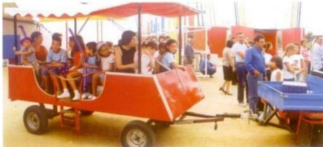
O Camião Ecológico fez as delícias de miúdos e grandes