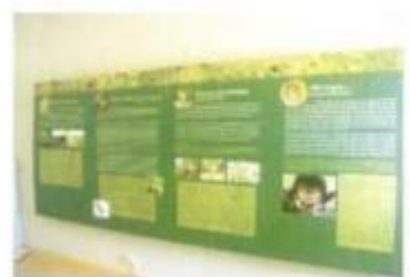
Pormenor da exposição permanente do Núcleo de Interpretação Ambiental