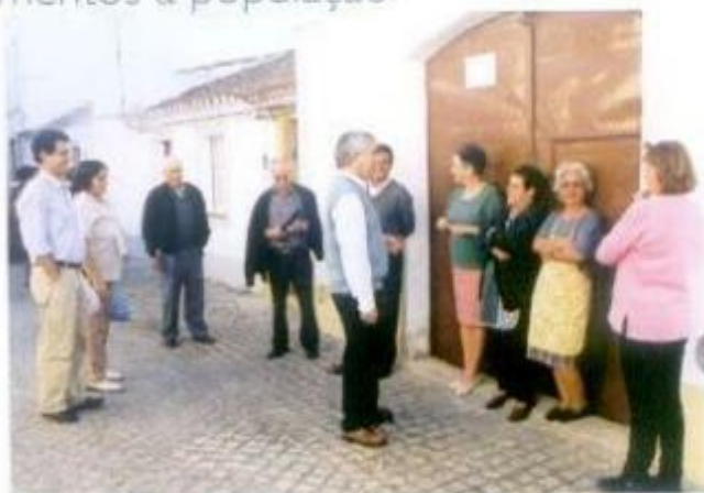
Encontro com a População das Freguesias Urbanas

No passado dia 24 de Outubro, realizou-se um Atendimento à população de S. Sofia, a 28 de Novembro foi a vez das Fazendas do Cortiço e a 19 de Dezembro semelhante iniciativa teve lugar em S. Gerardo. Nos Atendimentos, o Presidente da Câmara Municipal, atende todos os habitantes que lhe desejem colocar questões relativas à área de acção da Câmara Municipal.