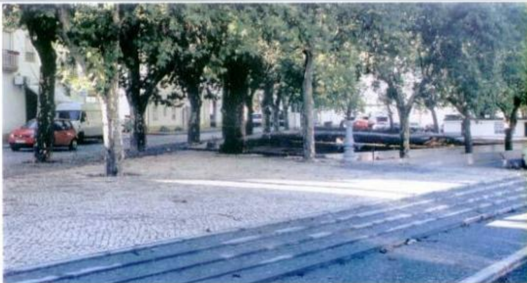
Os arranjos exteriores do Largo Machado das Santas prosseguem na cidade