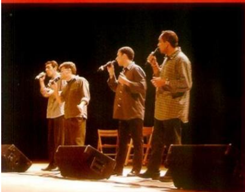
Os Terceiros marcaram o fim dos Mascabidos 2007 com um concerto a todo o nível musical