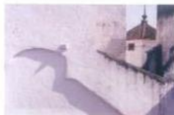
2.º Classificado: Leonel Vitorino