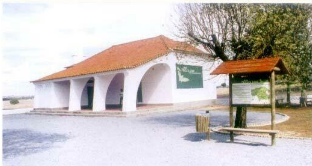
O Núcleo de Interpretação Ambiental dos Sítios de Cabrela e Monfurado foi instalado na antiga Escola Primária de Baidão.