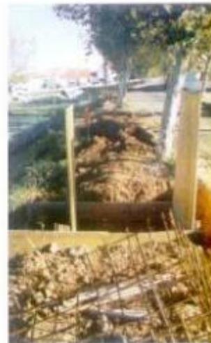
Iniciaram-se já as obras na Rua de N.ª Sr.ª Da Visitação e Dr. Vicente Augusto Pires de Silva, esta intervenção inclui a construção de passeios, parques de estacionamento e a implementação de vedações.