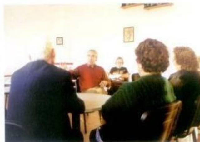
Atendimento à População de S. Sofia