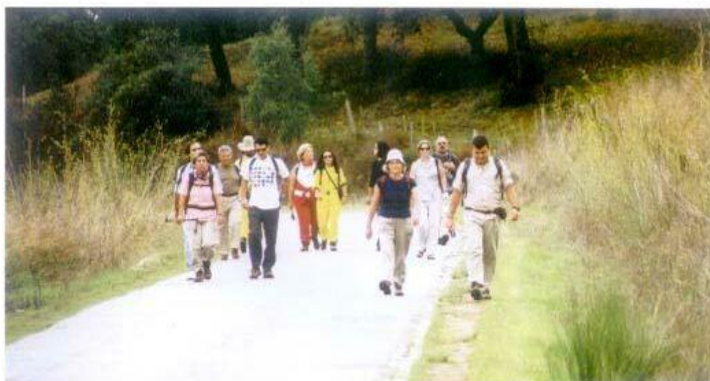
Os passeios pedestres são uma boa forma de passar um bom momento em contacto com a natureza.