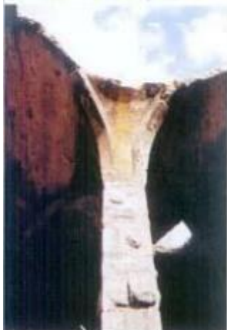
2.º Classificado: Tânia Grafina