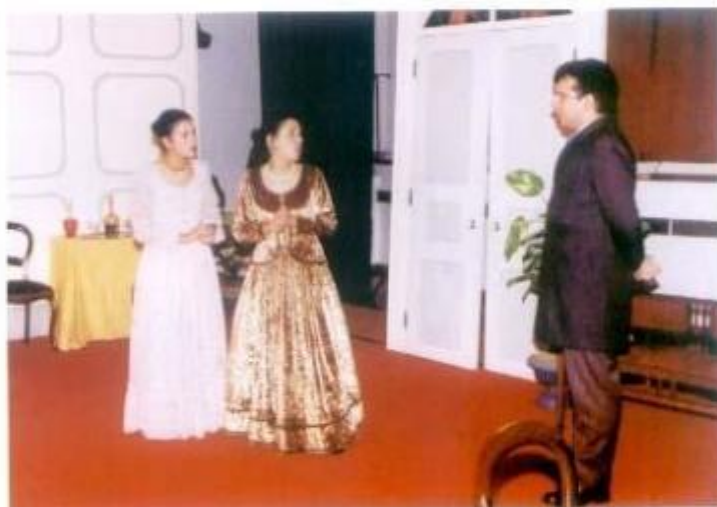
O teatro esteve presente no Multiplicidades com o Grupo de Teatro de Alpedrinhã (Fundão)

Fundada em 1962, a Orquestra Gulbenkian, percorre todos os anos em digressão um elevado número de localidades de Portugal, cumprindo desta forma uma significativa função descentralizadora.