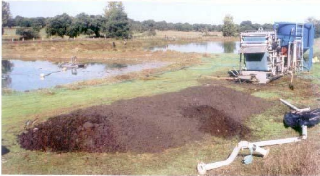
Remoção de Lamas e Limpeza da ETAR de Foros de Vale Figueira