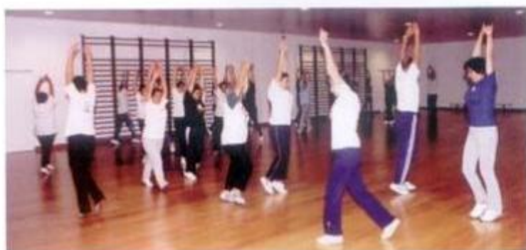
Ginástica para Adultos promovida pelo MDM (Movimento Democrático das Mulheres), com o apoio técnico da Câmara Municipal

Inaugurado no passado mês de Junho com a realização da Final da Taça de Portugal em Andebol feminino, o Pavilhão Gimnodesportivo de Montemor-o-Novo entrou em pleno funcionamento no passado mês de Outubro, contribuindo assim para o alargamento da oferta de equipamentos para a prática desportiva em Montemor-o-Novo.