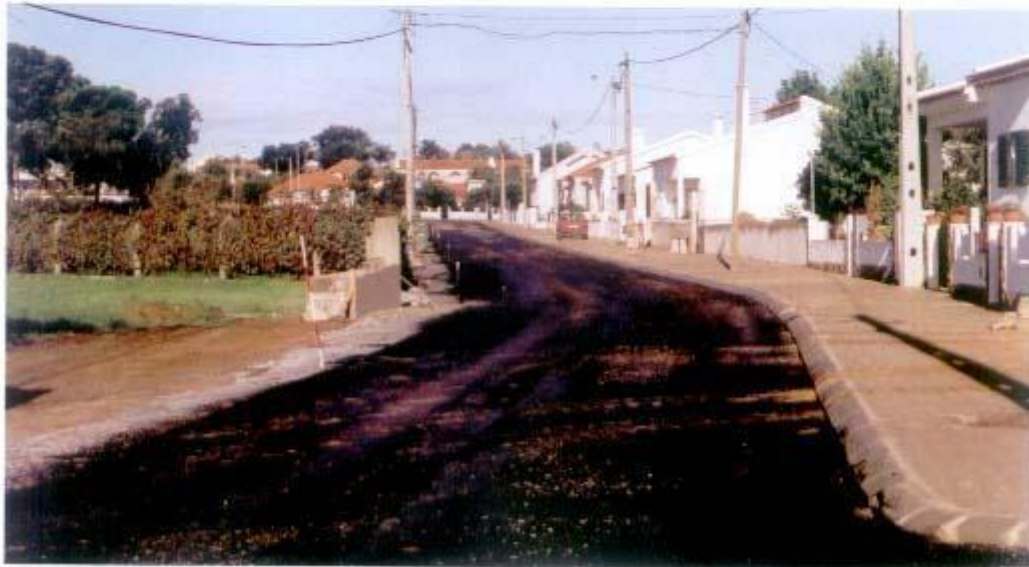
Pavimentação da Rua 1.ª De Maio, em Cortiços de Lavre