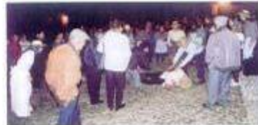
Recriação Histórica e Social "48 Anos"