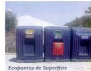
Ecopontos de Superfície