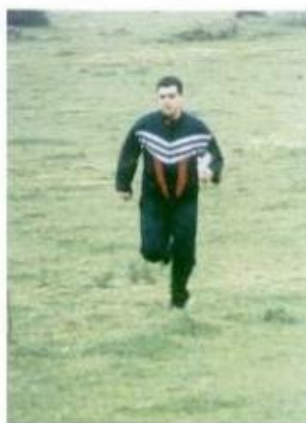
Atleta em plena prova

Foram incluídos na prova escalões abertos e de iniciação, com vários graus de dificuldade (física e técnica), adaptados a todas as idades e interessados, mesmo que nunca tivessem praticado orientação. Para