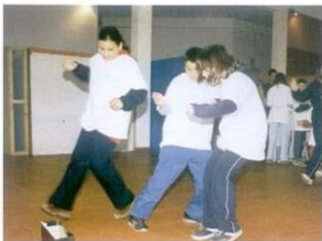
No Parque de Exposições as Escolas e Escolinhas do Desporto também se iniciaram na Orientação Pedestre.

Montemor recebeu em Junho do ano passado o Campeonato Nacional de Orientação em BTT. Na sequência desta prova, o Clube Português de Orientação e Corrida e a Câmara Municipal de Montemor-o-Novo trabalharam em conjunto, nos últimos meses, de forma a proporcionar a todas as pessoas de todas as idades, nova possibilidade de experimentar tudo o que a Orientação pode oferecer. Assim, de 31 de Janeiro