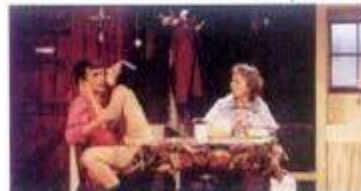
Comemorações Dia Mundial do Teatro