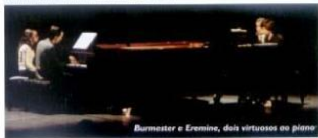
Burmester e Eremine, dois virtuosos ao piano