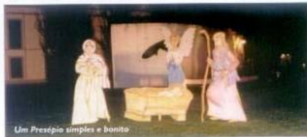
Um Presépio simples e bonito