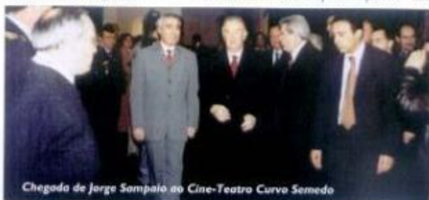
Chegada de Jorge Sampaio ao Cine-Teatro Curvo Semedo