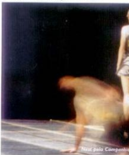
Nazé pela Companhia

Segundo o Presidente da República "o mundo não está fácil, a paz é algo difícil e o desenvolvimento também, no entanto, é preciso termos a noção de que com o nosso rigor e iniciativa