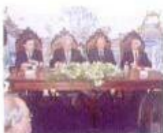
Sessão Solene de Abertura