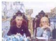
IX Encontro do CEDA