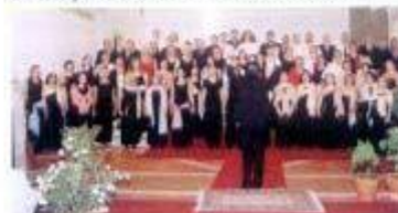
I Encontro Internacional de Caras