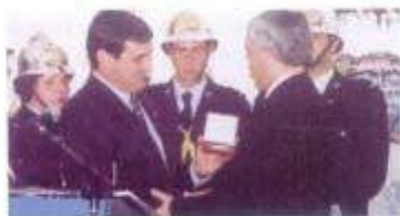
Liga dos Bombeiros Portugueses entrega Crachá de Ouro à Câmara Municipal