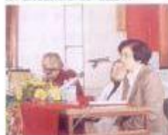
Dia Mundial do Trabalhador