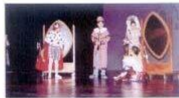
Musical "121 em 1503", pela Oficina do Canto