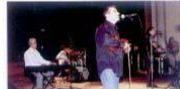
Ronda dos 4 Caminhos