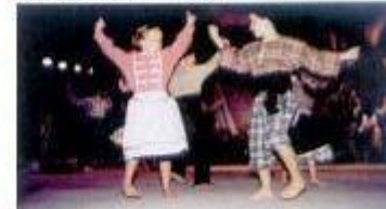
Mostra Internacional de Folclore