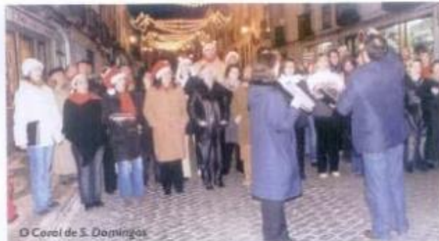
O Coral de S. Domingos

Tratou-se de mais uma iniciativa de sucesso da autarquia, certamente a repetir em 2004.