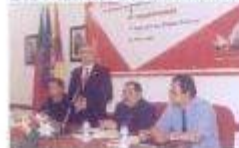
Ciclo de Conferências B.V. Montemor