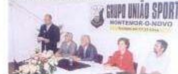
Inauguração das Bancadas do G.U.S.