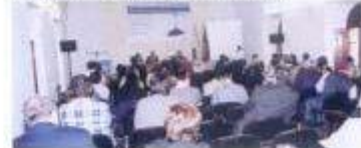
Colóquio "Os Municípios no Portugal Moderno"