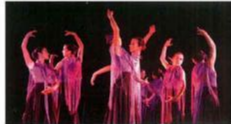
Espectáculo de Sevillanas, pela Escola de Ballet da Câmara Municipal

Aproveitando a existência do Auditório do Parque Urbano, a Câmara Municipal de Montemor-o-Novo preparou uma programação cultural interessante e de qualidade , para que, a partir de Julho, as noites dos montemorenses, e não só, fossem bem preenchidas.