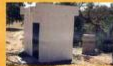
► Reforço de abastecimento de água - Foros de Vale de Figueira