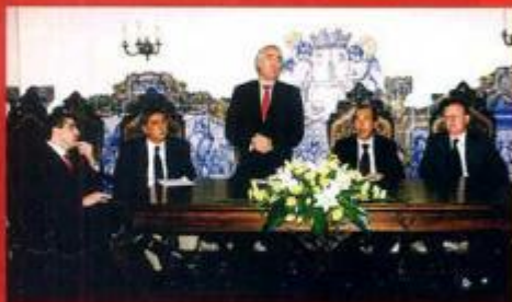
Apresentação do programa FAME Montemor - Fundo de Apoio às Microempresas do Concelho de Montemor-o-Novo

A Câmara Municipal tem vindo a dar uma particular atenção ao Movimento Cooperativo, importante sector da economia social do Concelho. Destaques, neste âmbito, para o Congresso Nacional das Cooperativas de Consumo que se realizou em Montemor de 14 a 15 de Novembro de 2003.