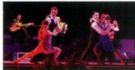
Espectáculo de Tango pela Companhia Arrabal Tango

À semelhança dos últimos anos, com a chegada das noites de Verão, nada melhor do que aproveitar os inúmeros locais que Montemor proporciona para bons passeios. Um destes locais é, sem sombra de dúvida, o Parque Urbano da Cidade . Com um arenoso espaço verde, fontes que emprestam alguma frescura à noite, o Parque Urbano de Montemor-o-Novo é um espaço privilegiado por centenas de montemorenses, como primeira escolha para uma noite agradável.