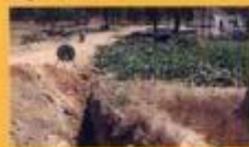
► Reforço da rede de água - Vale de Cortes - Cortiças de Lavre