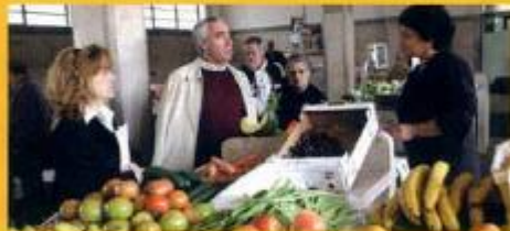
Encontro com a População - Mercado da Cidade