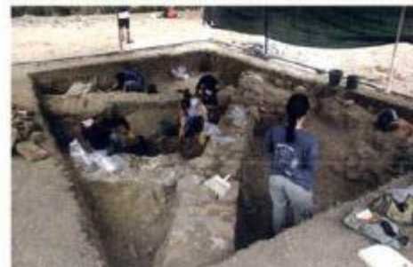
► Escavações Arqueológicas no castelo

Quais serão os segredos que terão sido descobertos este ano!