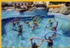
► Aula de Hidroginástica