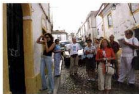
► Roteiro das Aldeias