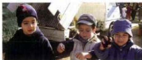
► Escolas visitam Unidade Piloto de Compostagem

A Unidade Piloto de Compostagem foi instalada em 2002 com o apoio do Programa Life-Ambiente, e teve por objectivo demonstrar a possibilidade de transformar resíduos orgânicos (restos de alimentos, podas de árvores, relva, folhas, estrumes de animais, serradura, etc) num fertilizante natural, reduzindo a deposição destes resíduos em aterro .