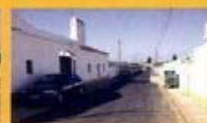
► Pavimentação - Rua Cláudio dos Reis, Santiago do Escoural