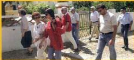
Encontro com a População - Freguesia N.º 5.ª do Bispo