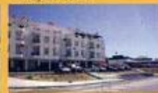
► Arranjos exteriores - Casaria da Pedreira