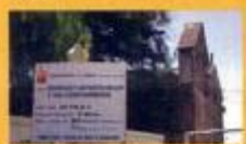
► Arranjos de recuperação - área de S. Tiago - Cortes