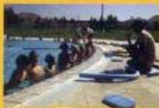
► Aula de natação