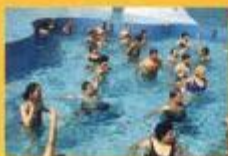
► Actividades Aquáticas com crianças da Cerimónia