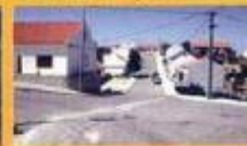
► Pavimentação de Ruas - Caborre