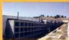
► Ampliação de Casa Nova - Casaria da Pedreira