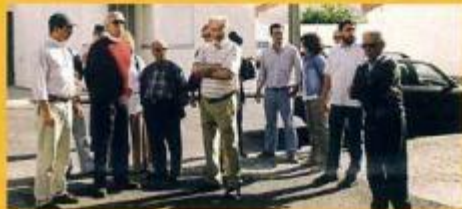
Encontro com a População - CHE/Courela da Pedreira

Nos Encontros com a População, o Presidente da Câmara, os Vereadores com Pelourros e os eleitos da Junta e Assembleia de Freguesia, num contacto directo e portanto mais próximo dos Montemorenses, obtêm um sem número de informações, opiniões e sugestões, por parte dos munícipes das localidades visitadas. Através deste conhecimento, a Câmara Municipal averigua de uma forma mais concreta as dificuldades e problemas de cada localidade do nosso concelho.