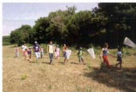
► Barbeatas, Libelinhas e Escaravelhos do Serrão de Monturado

Em breve prepare-se para uma nova série de Dias Tranquilos.