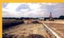
► Construção de Estar - Casa Branca