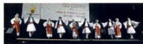
► Largo das Palmeiras acolheu III Mostra Internacional de Folclore.

Nos dias 13 e 14 de Agosto, no magnífico cenário do Largo das Palmeiras, registaram-se os pontos altos da III Mostra Internacional de Folclore . Perante um imenso público realizaram-se, no sábado, a Grande Gala da Mostra e, no domingo, a Gala das Nações .