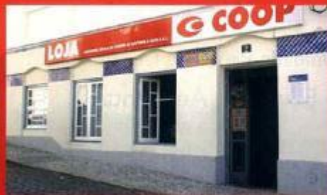
Cooperativa Popular de Consumo do Concelho de Montemor-o-Novo

No âmbito do seu projecto empresarial, a Cooperativa Popular de