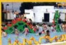
► Jogos Aquáticos com crianças das Escolas Básicas e Jardins de infância

As Piscinas Municipais de Montemor-o-Novo, apesar da redução de horários, de modo a poupar em cerca de um terço o consumo de água inerente ao seu funcionamento, proporcionam aos Montemorenses uma série de actividades desportivas.