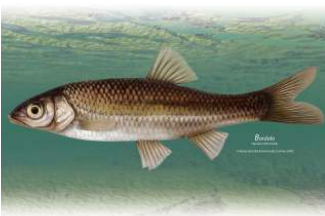
Figura 7 – Boga-portuguesa e bordalo, espécies piscícolas autóctones que ocorrem no Sítio de Monfurado.