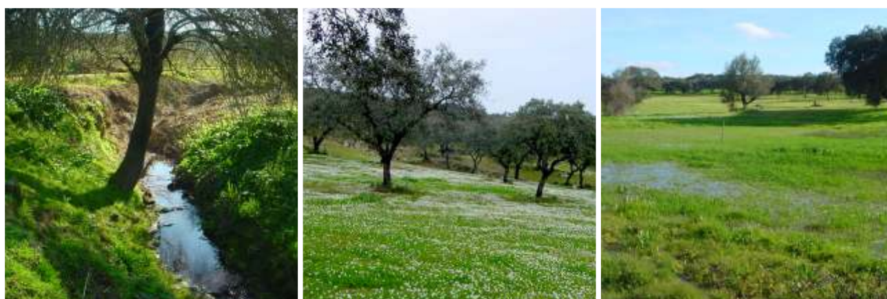
Figura 4 – Habitats com interesse para conservação, no Sítio de Monfurado: amiais, arrelvados e charcos temporários.

concentrarem numa única área aplanada, situam-se em herdades diferentes, pelo que, de acordo com a equipa responsável pela acção, deveriam beneficiar de uma gestão comum, sob pena do seu desaparecimento.