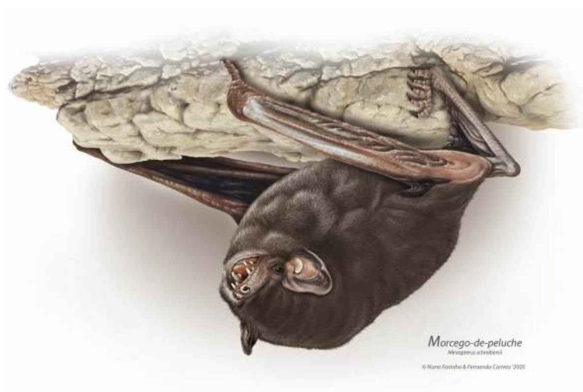
Figura 6 – Morcegos, um dos grupos faunísticos com maior interesse no Sítio de Monfurado.

Em termos faunísticos, e em particular no que diz respeito aos morcegos, trata-se de uma zona de grande importância, não só para hibernação como para reprodução. Em cavidades resultantes da antiga actividade mineira existem actualmente abrigos muito importantes para espécies como o morcego-rato-grande ( Myotis myotis ), morcego-de-ferradura-mediterrânico ( Rhinolophus euryale ), morcego-de-ferradura-grande ( Rhinolophus ferrumequinum ), morcego-de-ferradura-pequeno ( Rhinolophus hipposideros ) e morcego-de-ferradura-mourisco ( Rhinolophus mehelyi ). Alguns destes locais foram objecto de implementação de infra-estruturas com vista a controlar o acesso de pessoas não autorizadas, por parte da ex-DRAOTA. A conservação da área envolvente, constituída por montados, florestas de quercíneas e galerias ripícolas relativamente bem conservadas, assume um papel importante na conservação das espécies em questão, como zona de alimentação.