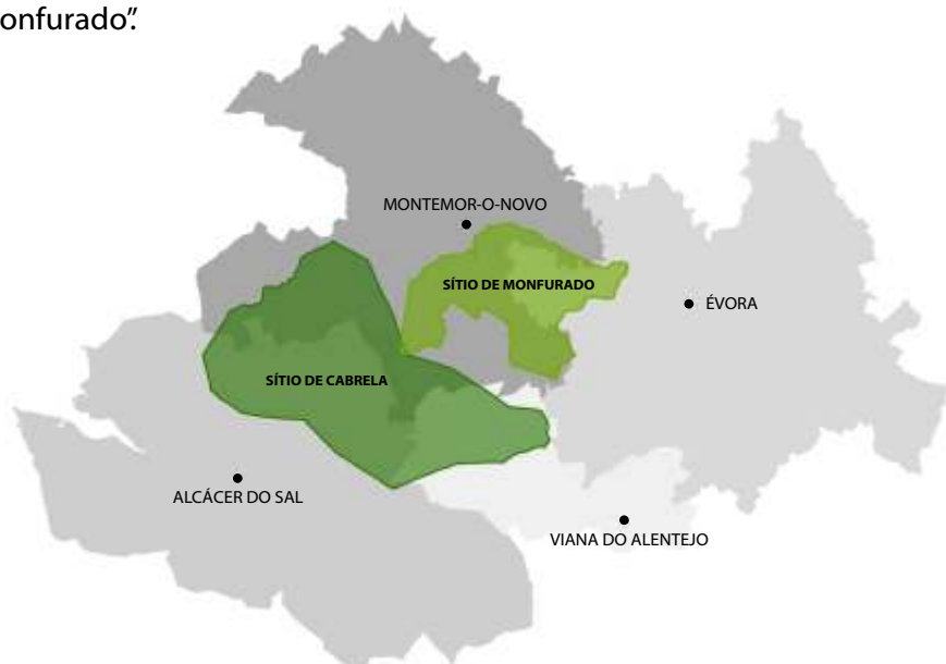
Figura 2 – Distribuição dos Sítios de Cabrela e Monfurado

O concelho de Montemor-o-Novo é abrangido por dois Sítios Natura 2000: o “Sítio de Cabrela” e o “Sítio de Monfurado”.