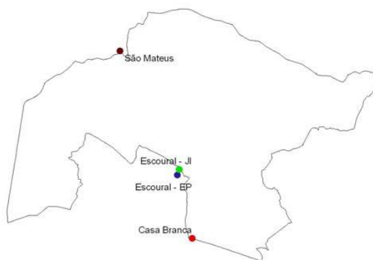
Figura 2 – Localização das escolas abrangidas pelas actividades regulares no âmbito da Acção E1, durante o ano lectivo 2004/05

No âmbito da Acção E1, foram desencadeados desde o início do Projecto um conjunto de trabalhos preparatórios que envolveram desde logo as equipas da CMMN e do CEBV-FCUL. Estes trabalhos permitiram trabalhar, durante o ano lectivo 2004/05, um conjunto de actividades que se desenvolveram com as escolas e jardins-de-infância de Casa Branca, Escoural e São Mateus.