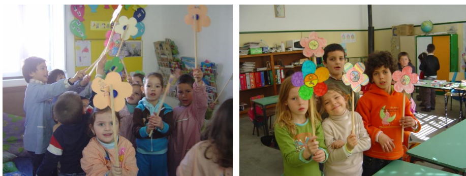
Figura 6 - Construção de moinhos de vento