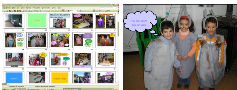
Figura 10 - Exemplo da apresentação (powerpoint) estruturada para assinalar o final do ano lectivo 2006/2007

À semelhança do que tinha acontecido nos anos lectivos anteriores, para o último ano lectivo passível de decorrer no âmbito do Projecto, foram também realizadas reuniões com os educadores/professores. Abrangendo um total de 111 alunos repartidos por seis turmas, nomeadamente, três de jardim-de-infância (Escoural, São Mateus e São Cristóvão) e três de EB1 (São Mateus – 2 turmas, e São Cristóvão), a equipa da CMMN trabalhou três dos quatro subprogramas propostos, sendo que, o tema dos carvalhos foi trabalhado pelo maior número de salas (três), seguido pelo tema do rato de Cabrera (duas) e dos morcegos (uma), não sendo o tema dos narcisos trabalhado por qualquer criança.