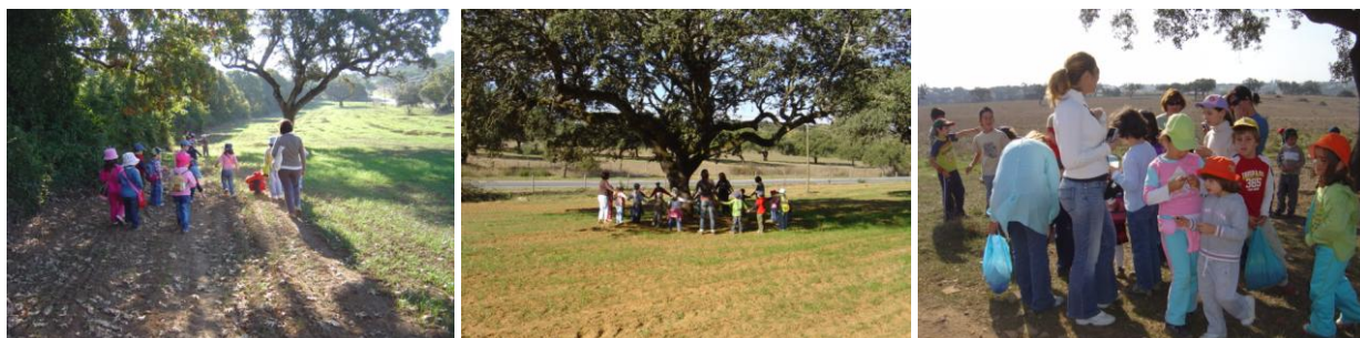
Figura 11 - Saída de campo para recolha de bolotas; experiência efectuada no sentido dos alunos as plantarem e avaliarem a germinação das mesmas.