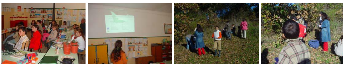
Figura 3 – Actividades desenvolvidas em Dezembro de 2004 pelos alunos da EB1 do Escoural

No final do ano lectivo, e depois de concluídas as actividades inicialmente propostas, foi aplicado aos professores um inquérito, através do qual se tentou saber, junto dos docentes, quais as opiniões em relação às actividades desenvolvidas.