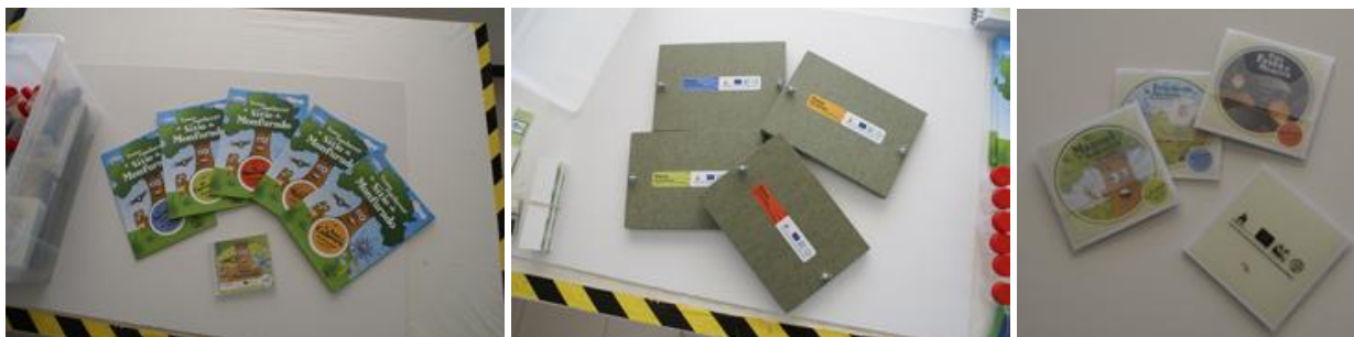
Figura 15 – Alguns dos materiais que integram o kit pedagógico “Vamos conhecer...o Sítio de Monfurado”

Concebido e produzido, na sua versão final, no último semestre de 2007 e no primeiro de trimestre de 2008, foi contactado, em Março do ano anterior, o Agrupamento de Escolas no sentido de se definir uma melhor estratégia para a entrega e distribuição do kit pelos jardins-de-infância e escolhas básicas do 1º ciclo do concelho. No entanto, e devido ao facto do ano lectivo se encontrar em velocidade de cruzeiro, o Agrupamento sugeriu adiar a entrega dos kits para o início do próximo ano lectivo, previsto então para 10 de Setembro de 2008.