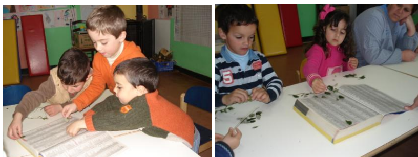
Figura 12 - Construção de Herbário e utilização de folhas secas para construção de marcadores de livros