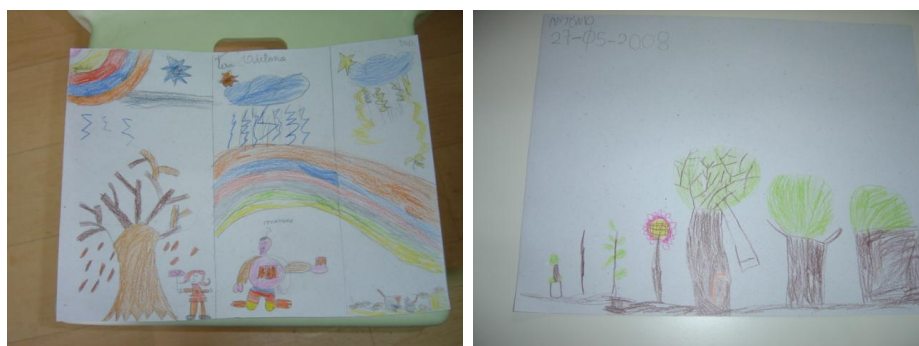
Figura 14 - Exemplo de trabalhos realizados pelos alunos