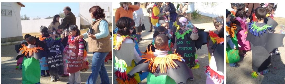
Figura 4 – Desfile de Carnaval com os alunos do jardim-de-infância do Escoural