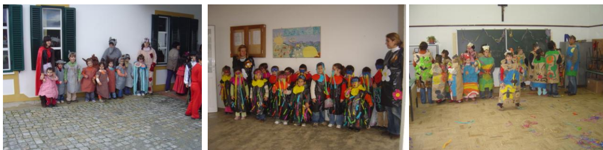
Figura 7- Desfiles de Carnaval