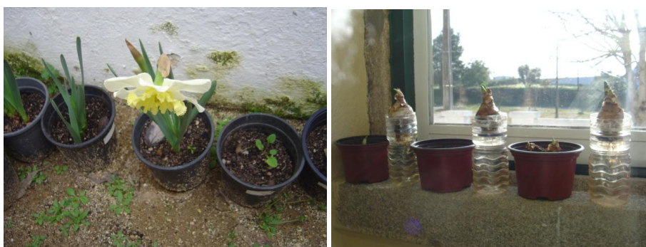
Figura 5 - Plantação de jacintos domésticos; experiência efectuada com bolbos no sentido dos alunos avaliarem a germinação dos mesmos em diferentes condições