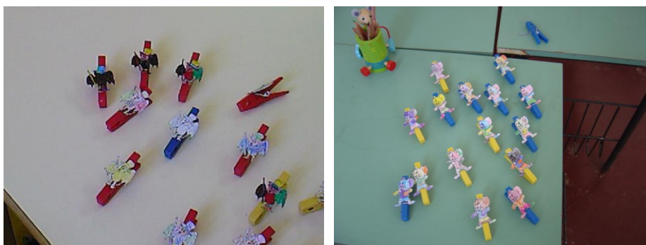
Figura 9 – Construção de Molas (morcegos e ratinhos)