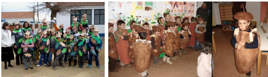
Figura 13 - Desfile de Carnaval sob o tema dos carvalhos (esquerda) e rato de Cabrera (direita)