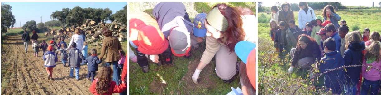
Figura 8 – Saídas de campo, com a colaboração da equipa da UE, para observação de túneis e latrinas de rato de Cabrera