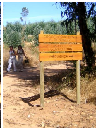
Tipo de estruturas informativas instaladas nos caminhos