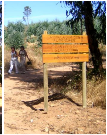
Tipo de estruturas informativas instaladas nos caminhos