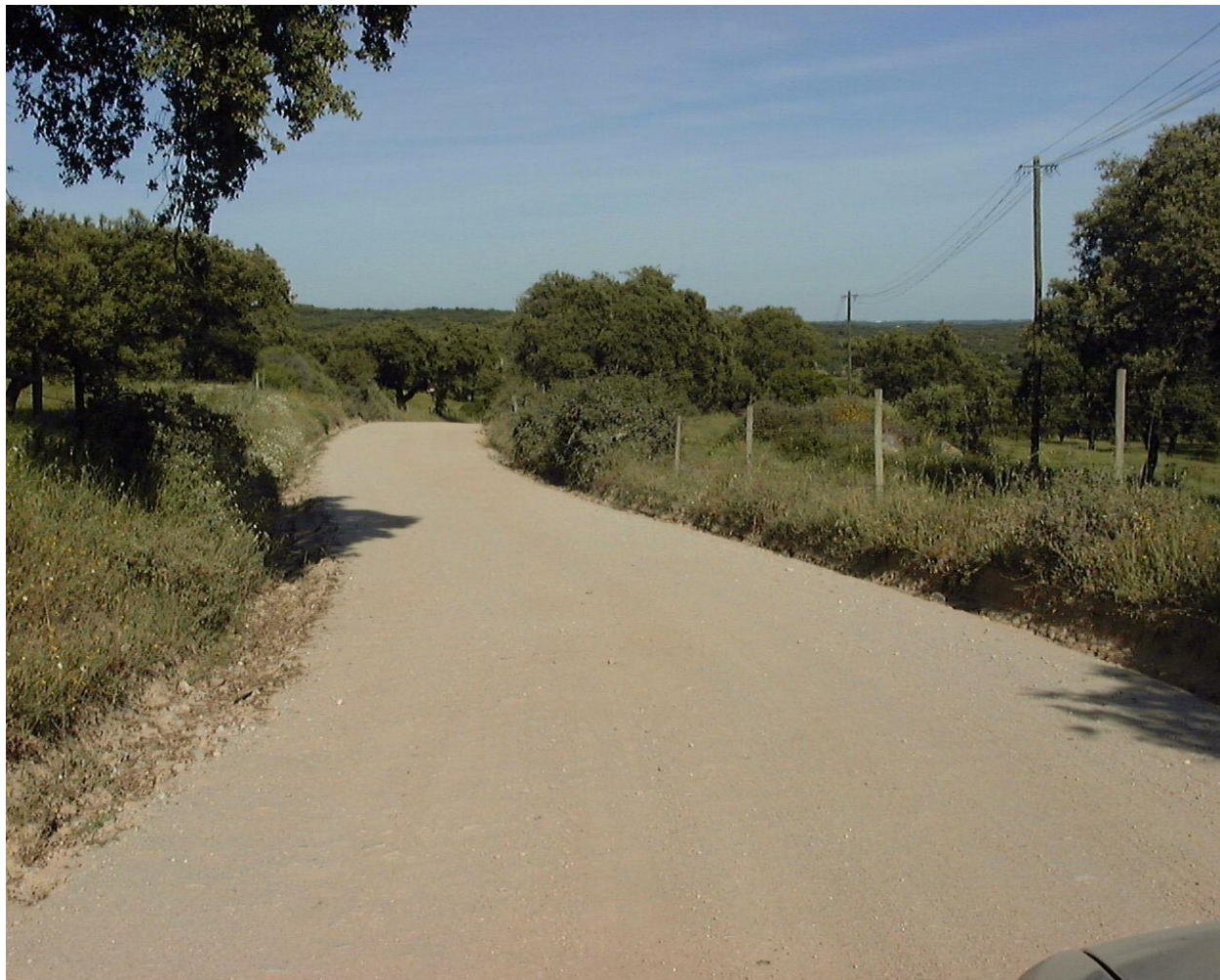
Aspecto do caminho após intervenção no pavimento

A execução desta tarefa inclui os seguintes trabalhos: regularização do pavimento com uma máquina motoniveladora (assistência externa), rega do pavimento e cilindragem para compactação (administração directa).