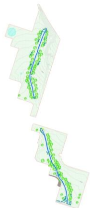
Plano de Plantação

Tem como principal objetivo ajudar a recuperar as margens de um pequeno troço de linha de água, dando a conhecer a sua importância . Os trabalhos incluem: plantações, limpeza de resíduos e vegetação, preservação de taludes, sensibilização, inquéritos, etc.